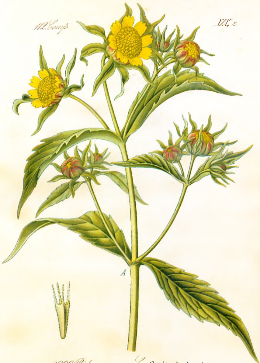
2990. Bidens cernuus L. Auntgundenkraut.