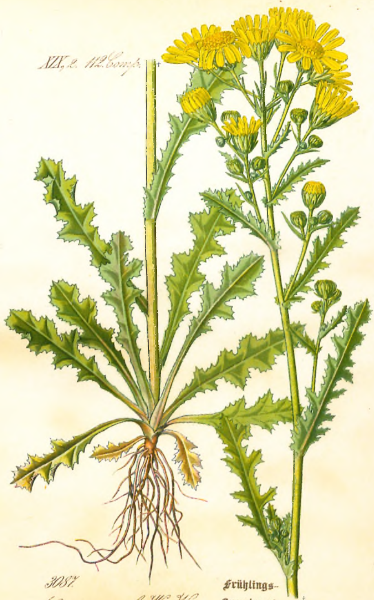
3037 Senecio vernalis W. & A.