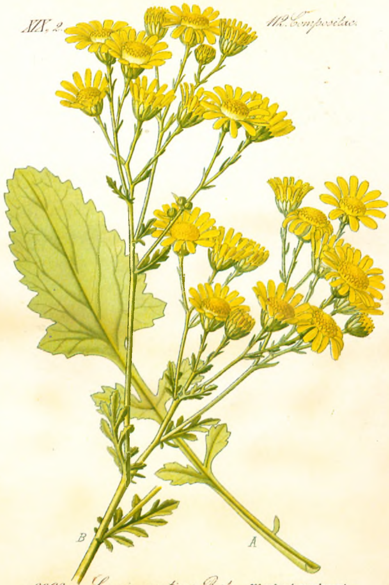
3092. Senecio erraticus Berl. Wanderkreuzkraut.