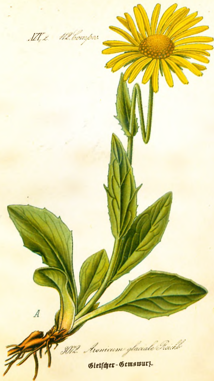
3012. Aronicum glaciale Reichb. Gletscher-Gewurz.