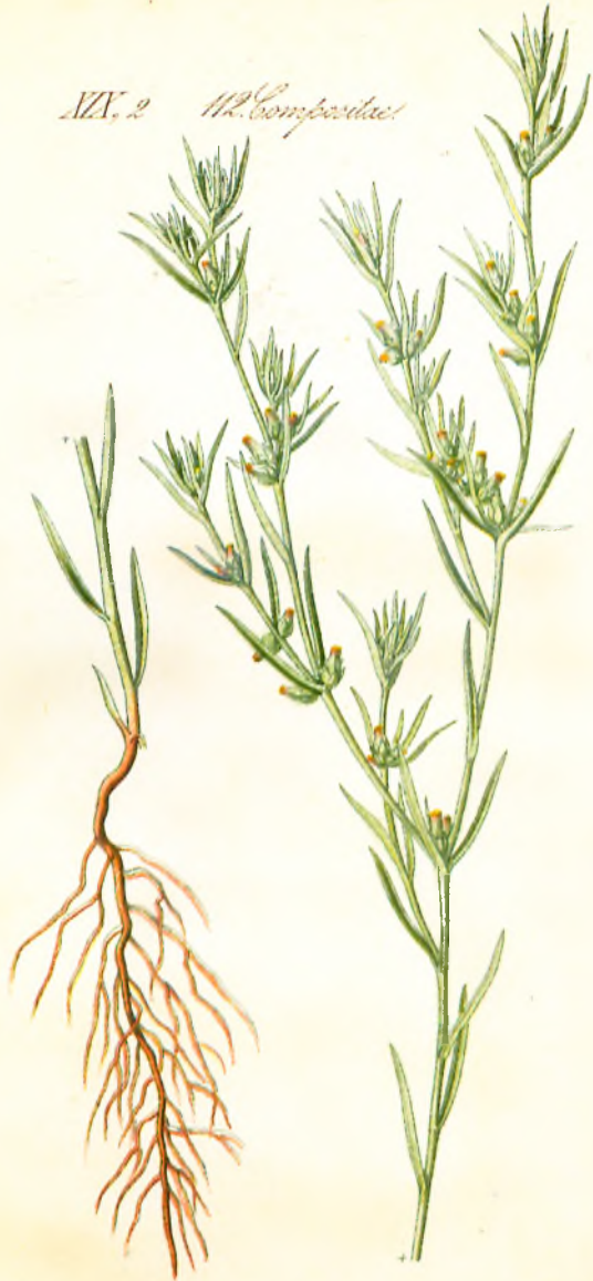
3055. Felago gallica L. Schimmelkraut.