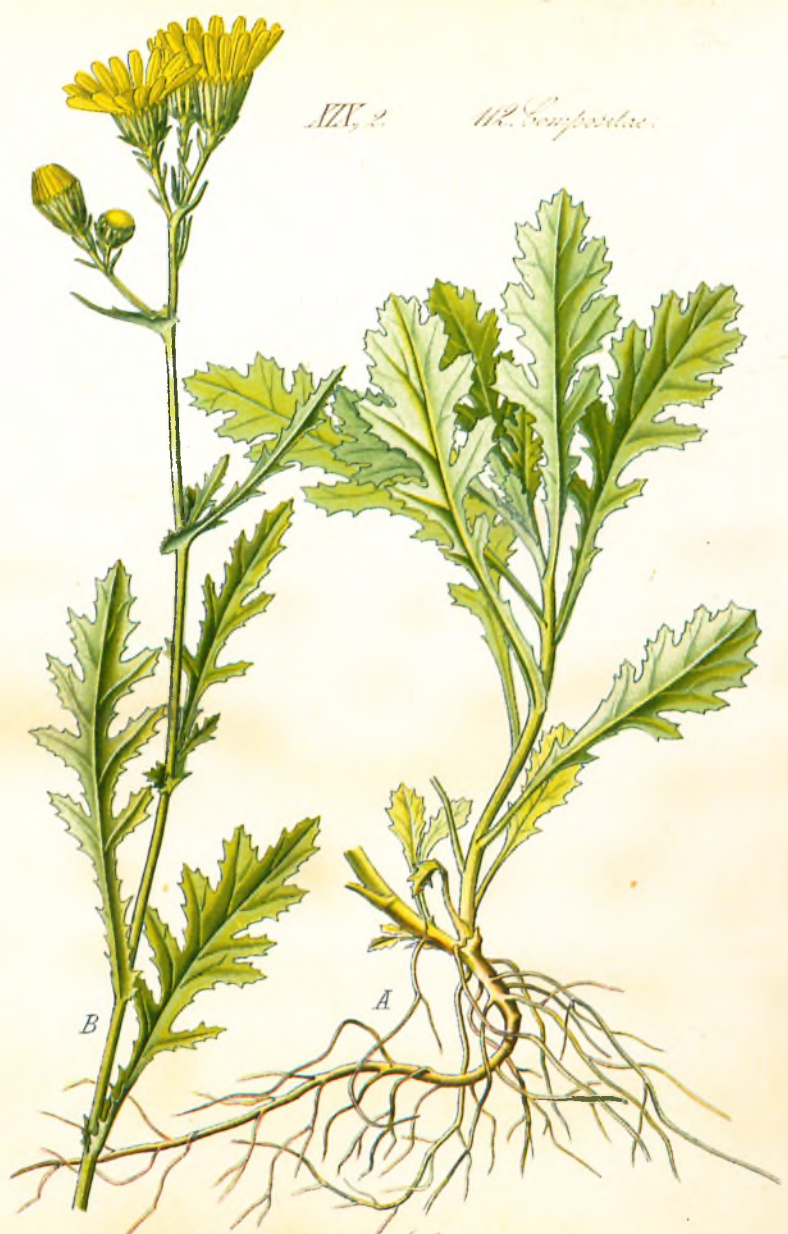
1128. Senecio nebrodensis L. Felsen-Kreuzkraut.