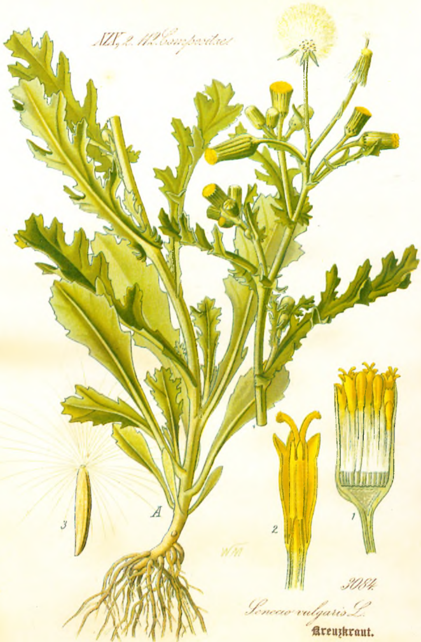
Senecio vulgaris L. Kreuzkraut.