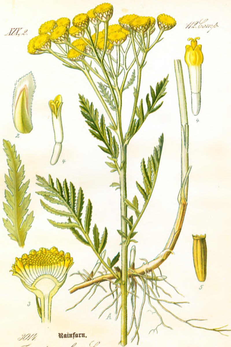
3014. Rainsarn. Tanacetum vulgare L.