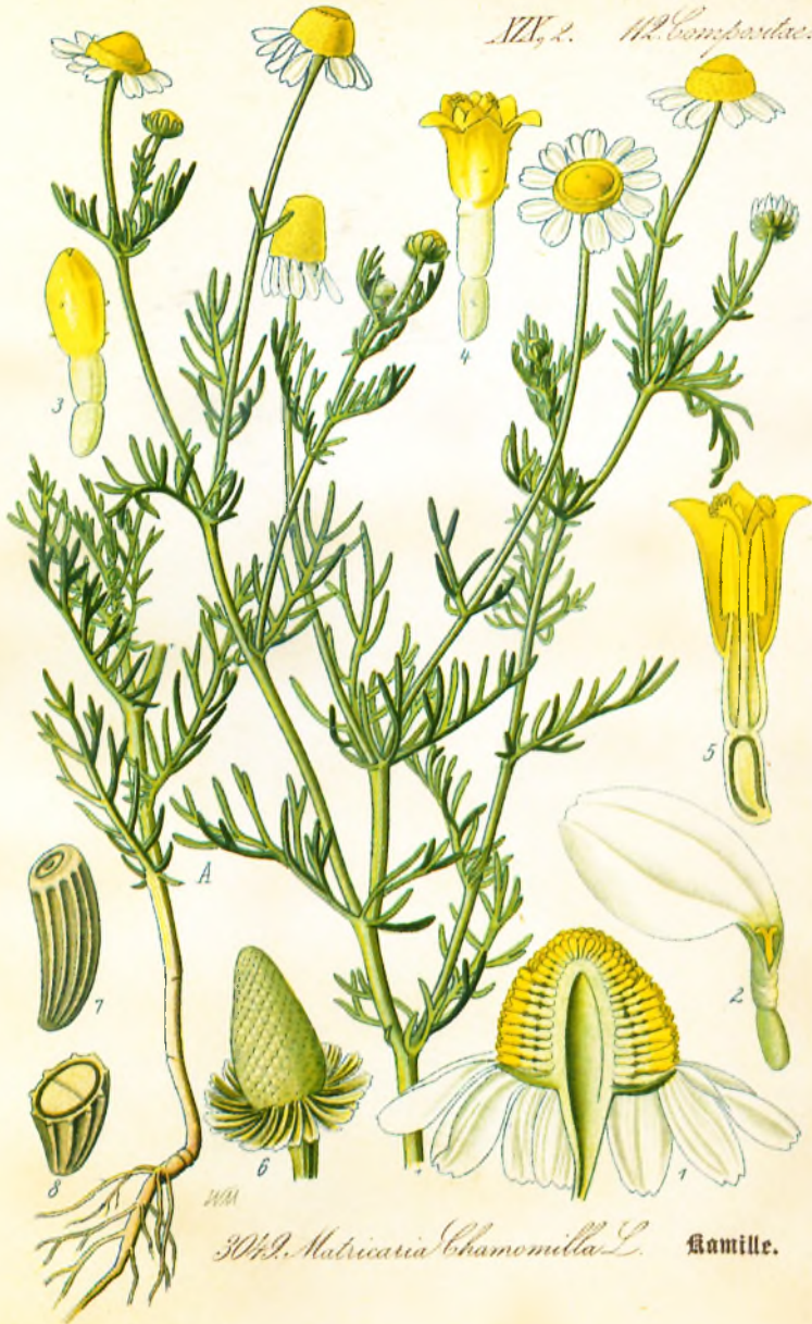
3042. Matricaria Chamomilla L. Kamille.