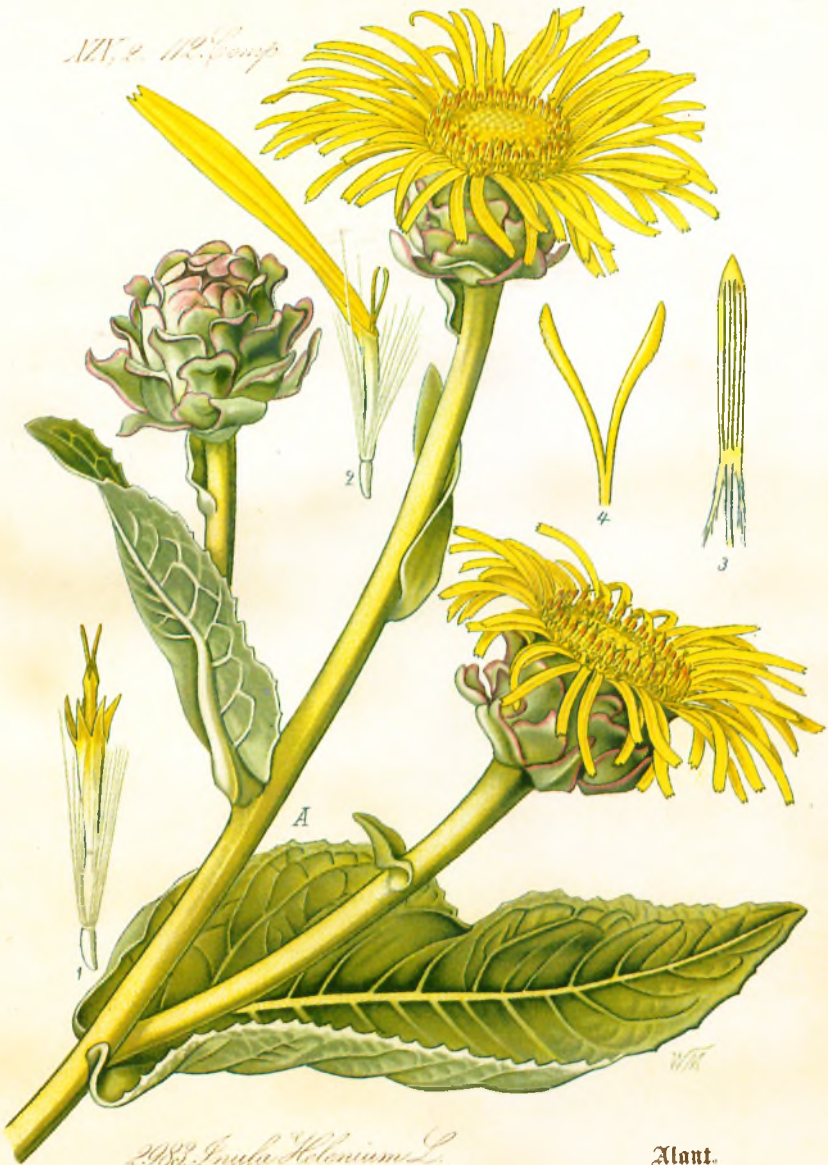
2988. Inula Helonium L.