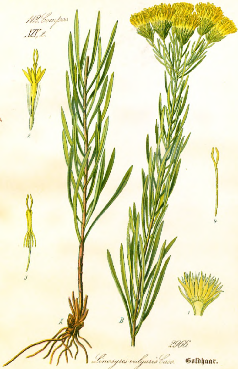
2966 Linosyris vulgaris Carr. Goldhaart.