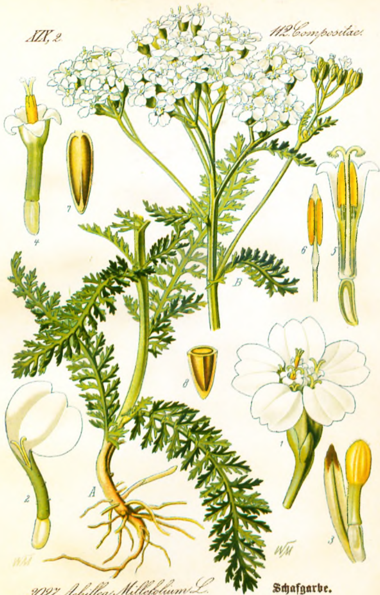
3027. Achillea Millefolium L.