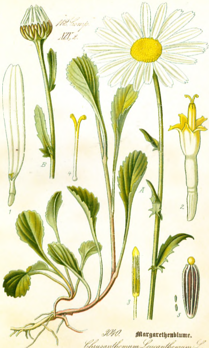
3040. Margarethenblume. Chrysanthemum Leucanthemum L.