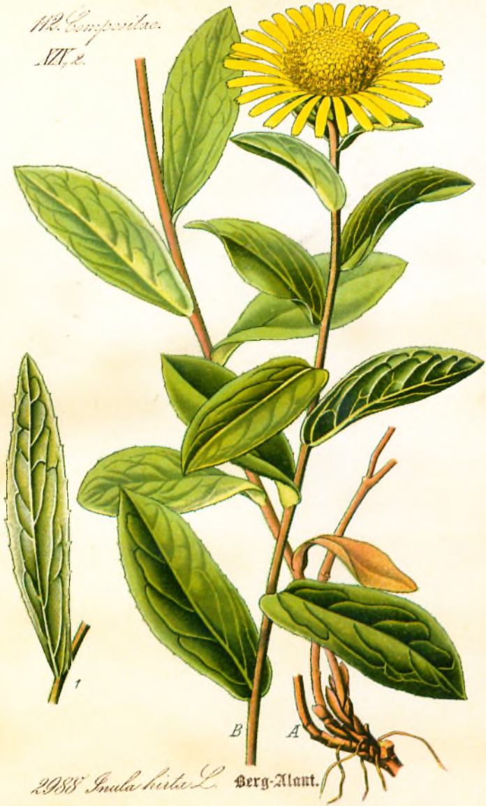
2988 Inula hirta L. Berg-Alant.