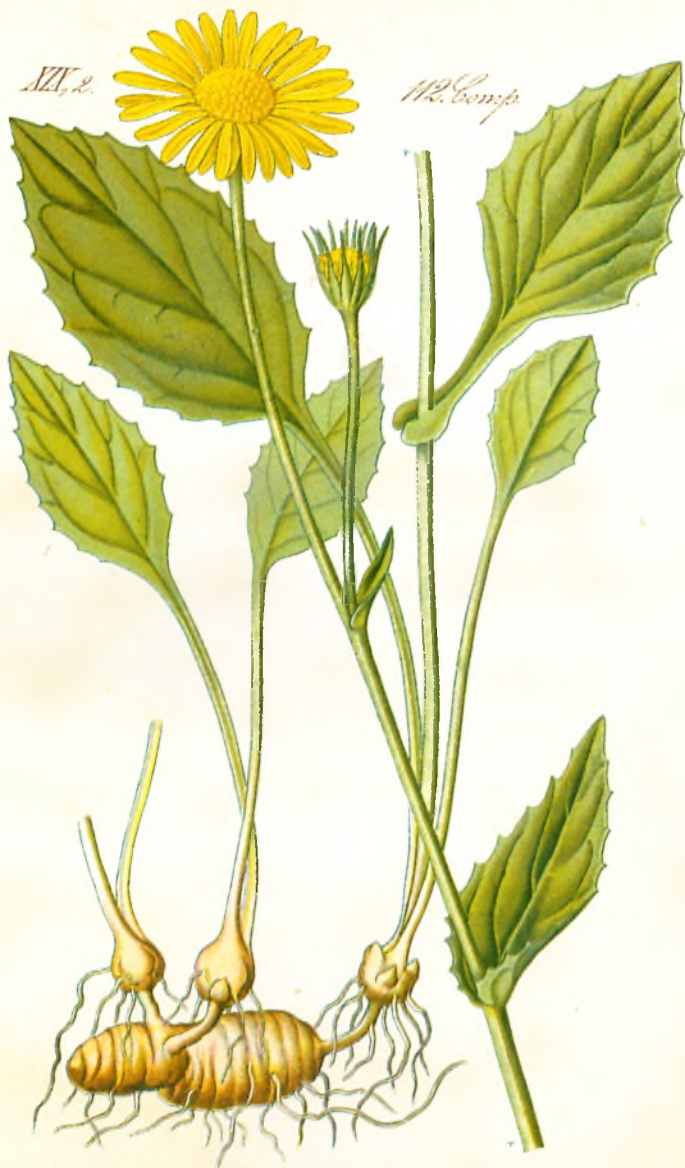
308. Doronicum scorpioides Willd. Wegbreit Genswurz.