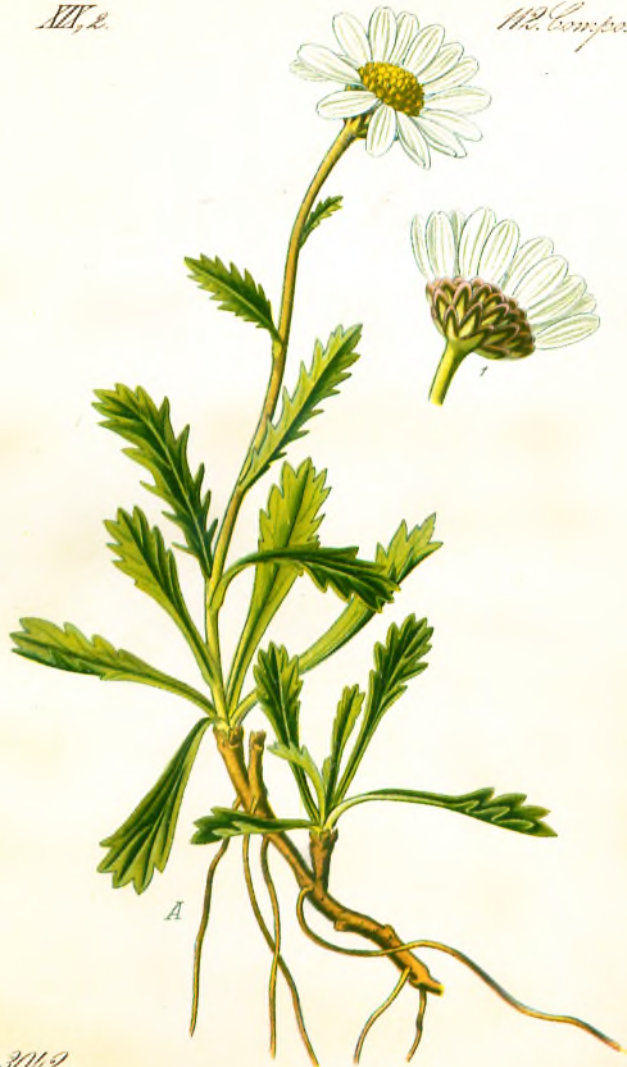
3042. Chrysanthemum coronopifolium Willd. 4409 Bräufußkraut.