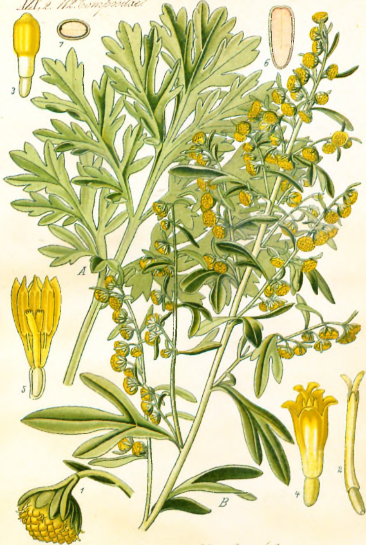
300. Artemisia Absinthium L. Wormuth.